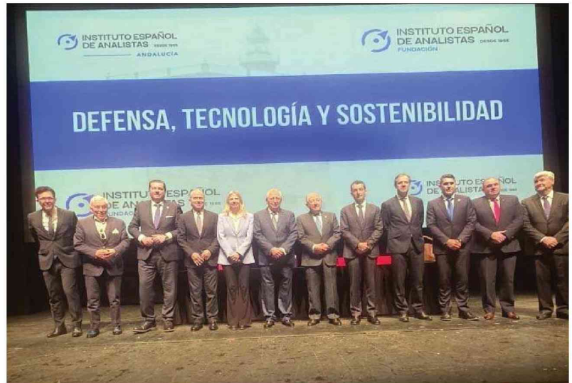
Autoridades y ponentes de la jornada de seguridad, en una foto de familia en el Kursaal

El Teatro Kursaal ha acogido este lunes una jornada sobre defensa y geopolítica organizada por el Instituto Español de Analistas en el que han participado ponentes de renombre como el presidente de Indra, Ángel Escribano; el analista financiero de Banco Santander, Carlos Treviño o el exdirector del CNI, el general de Ejército (R) Félix Sanz Roldán, en una mesa de debate ante numerosas autoridades civiles, militares y políticas.