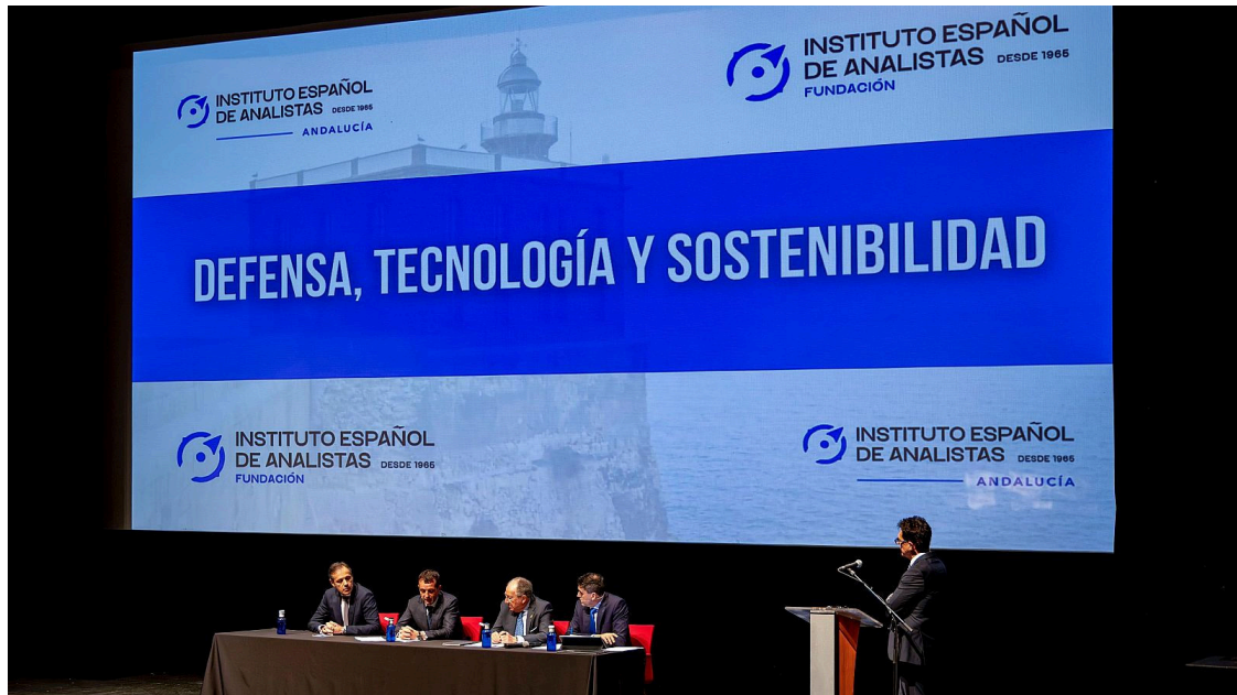
El Instituto Español de Analistas presenta en Melilla un informe sobre el sector de defensa | EFE

El informe Los cambios geopolíticos sobre el sector de defensa y sus necesidades financieras , presentado este lunes en Melilla por el Instituto Español de Analistas, concluye que Europa debe reforzar su industria de defensa y aumentar su capacidad tecnológica para reducir la dependencia de terceros países.