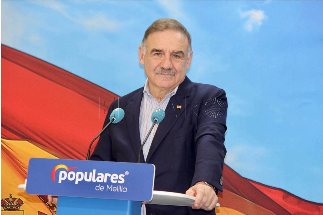
Senador del PP por Melilla

El senador del Partido Popular por Melilla y vicepresidente de la Asamblea Parlamentaria de la OTAN, Fernando Gutiérrez Díaz de Otazu, ha defendido la necesidad de reforzar la cohesión entre los países aliados durante su participación en la III edición del Foro de Defensa y Estrategia de París, celebrado este martes en la Escuela Militar de la capital francesa.