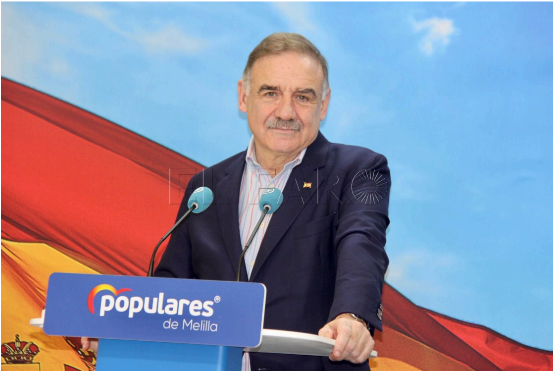
Senador del PP por Melilla