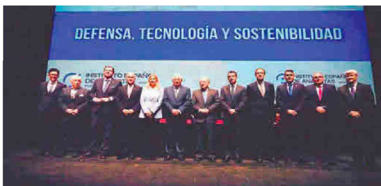
Foto de familia de los participantes de la I Jornada de defensa, tecnología y sostenibilidad.

Durante su discurso, el presidente de la Ciudad hizo referencia al complejo momento geopolítico actual, destacando la rapidez con la que evoluciona el panorama internacional: "La velocidad que lleva hoy este llamado Derecho Internacional es sideral".