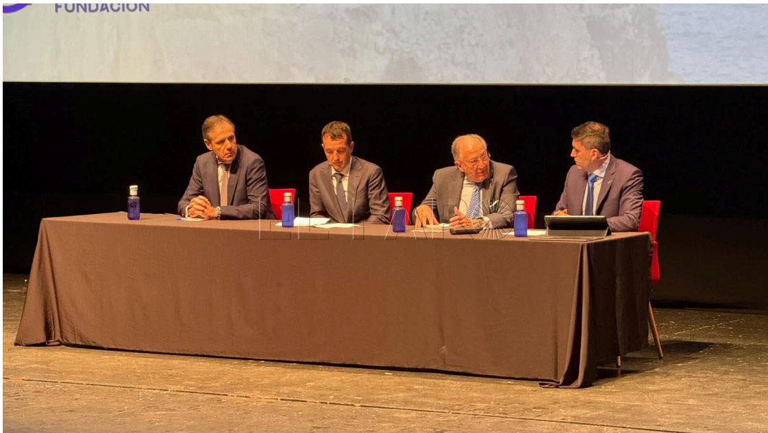
Momento del debate en la jornada de defensa.

El Teatro Kursaal Fernando Arrabal acogió en la mañana de este lunes la I Jornada de Defensa, Tecnología y Sostenibilidad, un foro de alto nivel que reunió en Melilla a destacados representantes del ámbito institucional, empresarial, académico y financiero para analizar los principales desafíos estratégicos que enfrenta el sector en el actual contexto internacional.