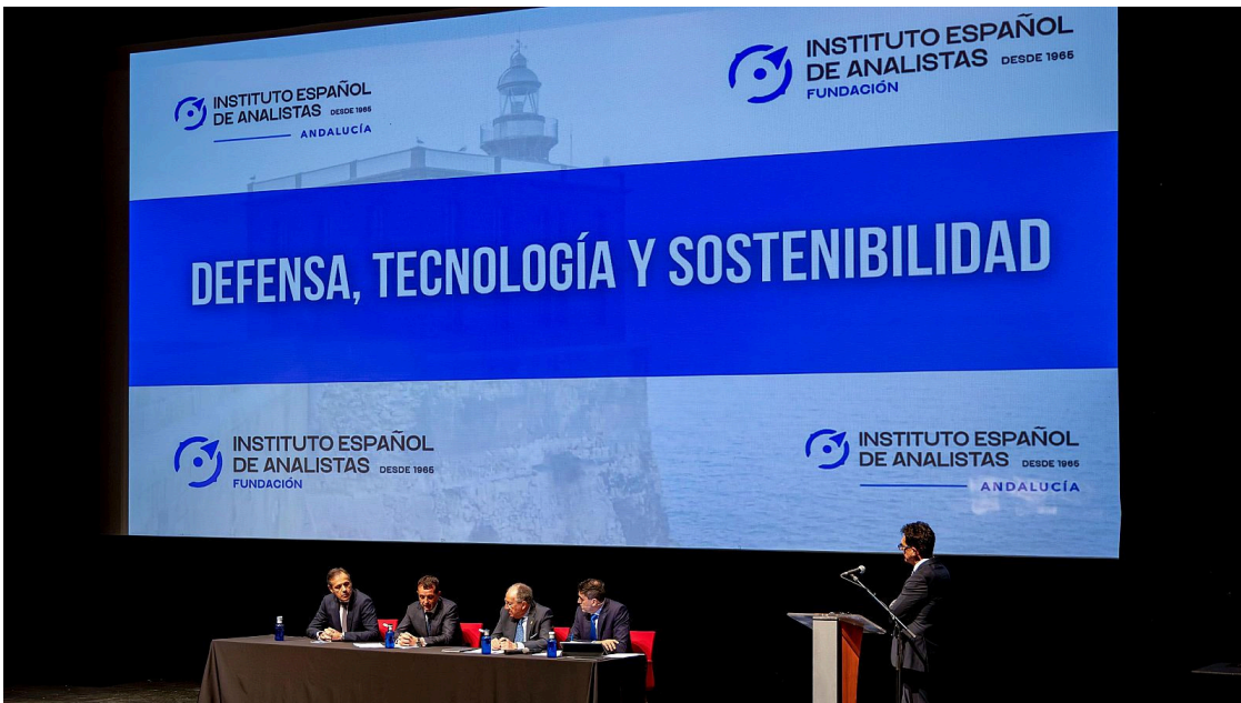
El Instituto Español de Analistas presenta en Melilla un informe sobre el sector de defensa | EFE

El informe señala que los recientes cambios en el orden internacional obligan a revisar la política de defensa europea, aumentar el gasto y facilitar la financiación del sector, incluyendo la participación de entidades financieras privadas y nuevos instrumentos de inversión.