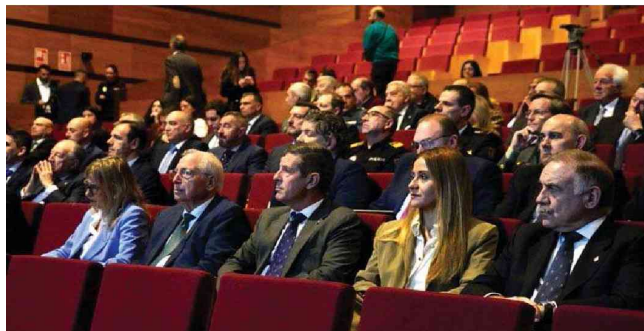
El presidente de la Ciudad, los parlamentarios nacionales y el comandante general de Melilla, entre otras autoridades asistentes a la jornada en el Kursaal

En este sentido, los ponentes han señalado que "la democracia debe de dotarnos de estabilidad", y que España destaca en el sistema de comunicación segura, con una industria "amplísima" dentro del sector de defensa.