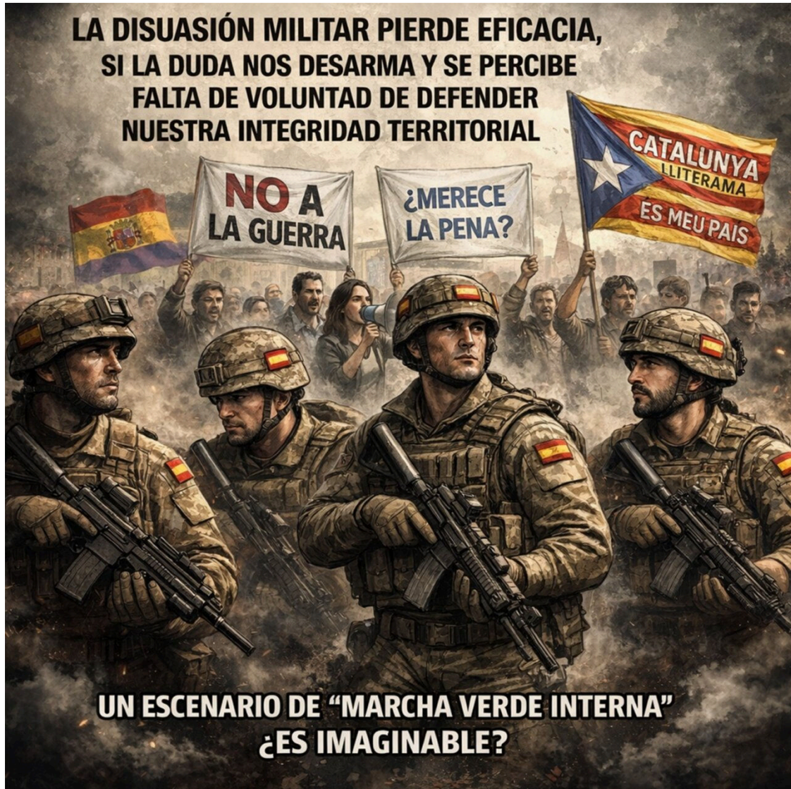
Ilustración sobre la defensa y sostenibilidad en Melilla con soldados y manifestantes.

Enrique Bohórquez López-Dóriga • original