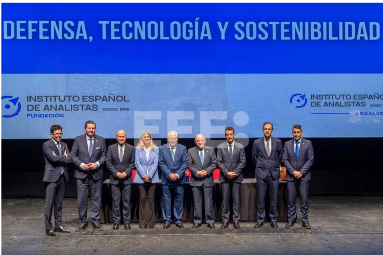
MELILLA, 23/03/2026.- Foto de familia de los participantes en la Jornada 'Defensa, Tecnología y Sostenibilidad' organizada por la delegación de Andalucía del Instituto Español de Analistas este lunes en el Teatro Kursaal Fernando Arrabal de Melilla.

Jornada Defensa, Tecnología y Sostenibilidad organizada por la delegación de Andalucía del Instituto Español de Analistas