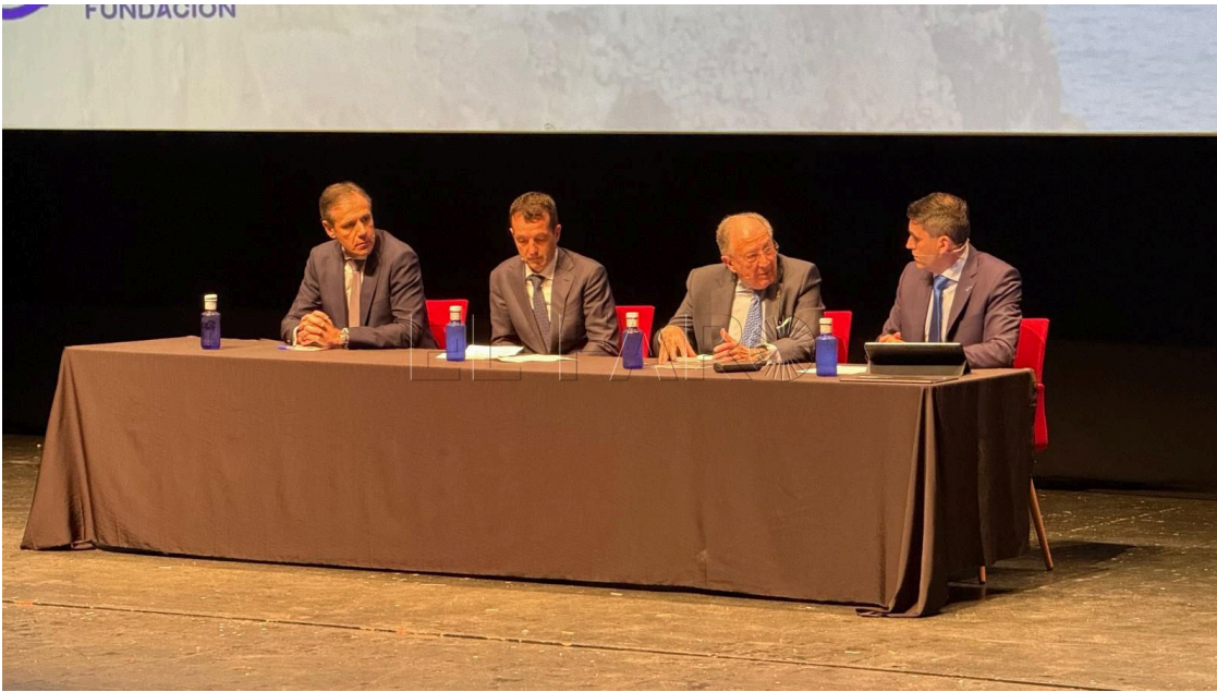
Momento del debate en la jornada de defensa.