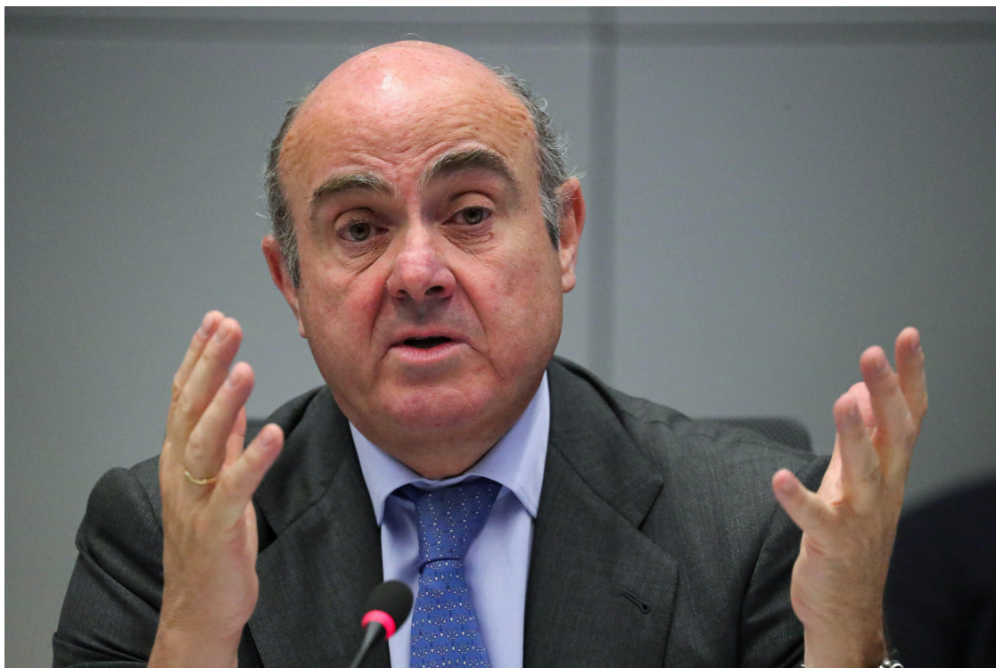
El vicepresidente del Banco Central Europeo, (BCE), Luis de Guindos

Luis de Guindos, vicepresidente del BCE, defiende que, en estos momentos en los que «Rusia es una amenaza», un mayor gasto en defensa «es una prioridad existencial» para la Unión Europea