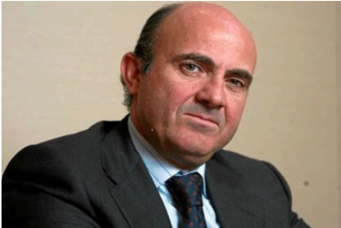
Vicepresidente del Banco Central Europeo (BCE), Luis de Guindos

El vicepresidente del Banco Central Europeo (BCE), Luis de Guindos , ha defendido el proyecto del euro digital , una iniciativa que podría estar operativa en 2029 y que, a su juicio, reforzará la autonomía estratégica de la zona euro en los sistemas de pago.