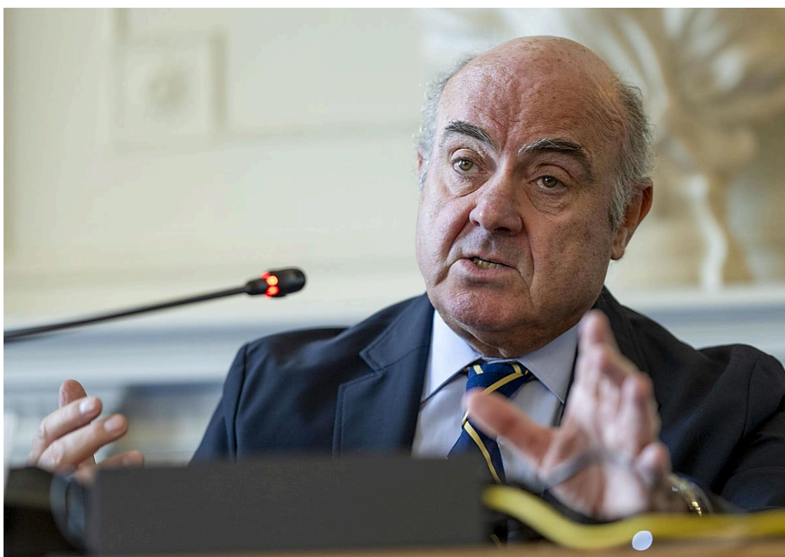
El vicepresidente del BCE, Luis de Guindos

Asimismo, sobre la situación de la vivienda , el vicepresidente del BCE ha puesto el foco en que la oferta de pisos no está sabiendo satisfacer el incremento poblacional que hay no solo en España sino en el conjunto de Europa. Un incremento de la población que viene principalmente de la inmigración, la cual considera De Guindos, en referencia a los flujos migratorios, que es fundamental para el crecimiento de Europa. «Deberíamos hacernos mirar la regulación del alquiler», ha ahondado.