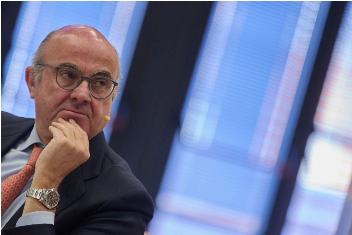
El vicepresidente del Banco Central Europeo (BCE), Luis de Guindos.

El vicepresidente del Banco Central Europeo, Luis de Guindos, ha sentenciado este lunes la necesidad de Europa de reforzar su gasto en defensa: "El paraguas es cada vez menor y menos fiable. Además, actualmente contamos con la amenaza constante de Rusia en nuestro continente".