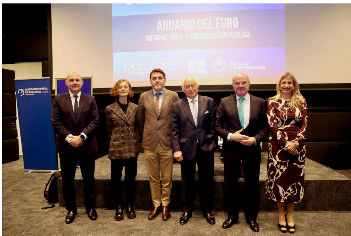
[Img # 66223]

The twelfth edition of the publication, presented in Madrid by Luis de Guindos and Juan María Nin, calls for accelerating decision-making in Europe, consolidating credible fiscal rules, and opting for strategic autonomy in the face of geopolitical fragmentation.