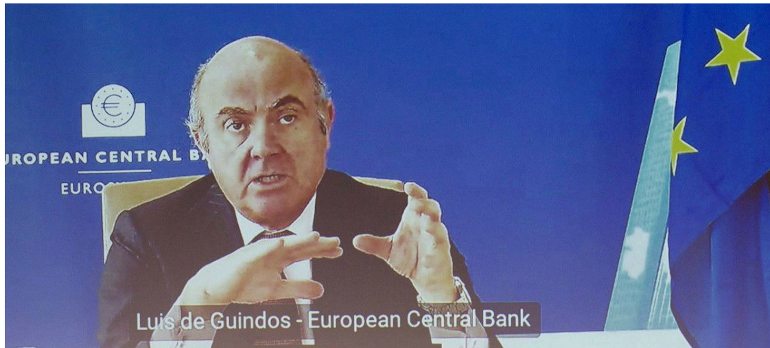
El vicepresidente del Banco Central Europeo, Luis de Guindos, en una imagen de archivo.

El vicepresidente del Banco Central Europeo (BCE), Luis de Guindos, ha dicho este lunes que, en este momento, la prioridad existencial número uno de Europa es la defensa, es decir, el rearme de sus ejércitos, palabra que tampoco gusta a Pedro Sánchez y a sus socios de la extrema izquierda y que tiene preeminencia sobre otras cuestiones, como el marco fiscal.