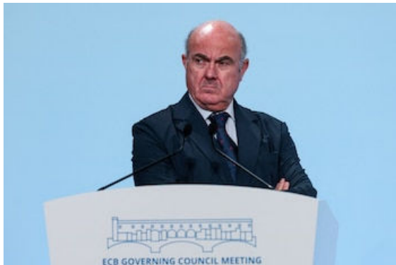
El vicepresidente del Banco Central Europeo (BCE), Luis de Guindos.

El vicepresidente del Banco Central Europeo (BCE), Luis de Guindos , ha defendido hoy dos medias contrarias a las respaldadas por el presidente del Gobierno español, Pedro Sánchez, la primera relacionada con el aumento del gasto en defensa y la segunda con la regulación del precio del alquiler .