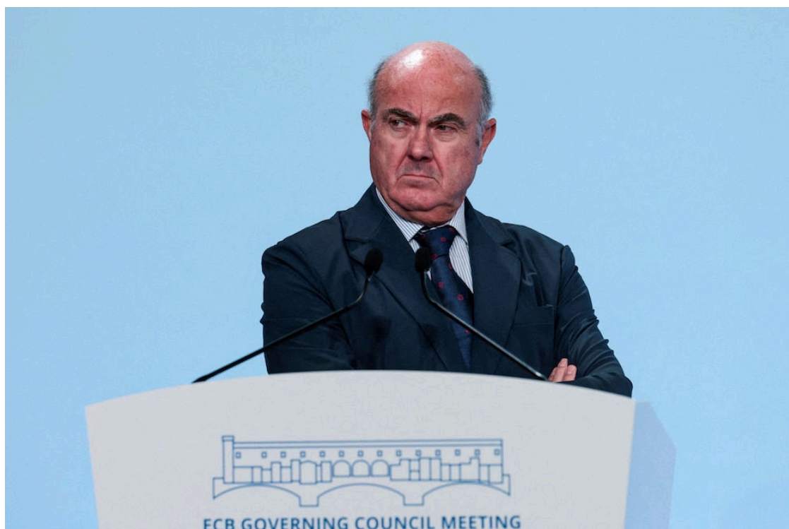
El vicepresidente del Banco Central Europeo (BCE), Luis de Guindos.

BCE Banco Central Europeo Luis de Guindos Pedro Sánchez Defensa España Economía España Noticias