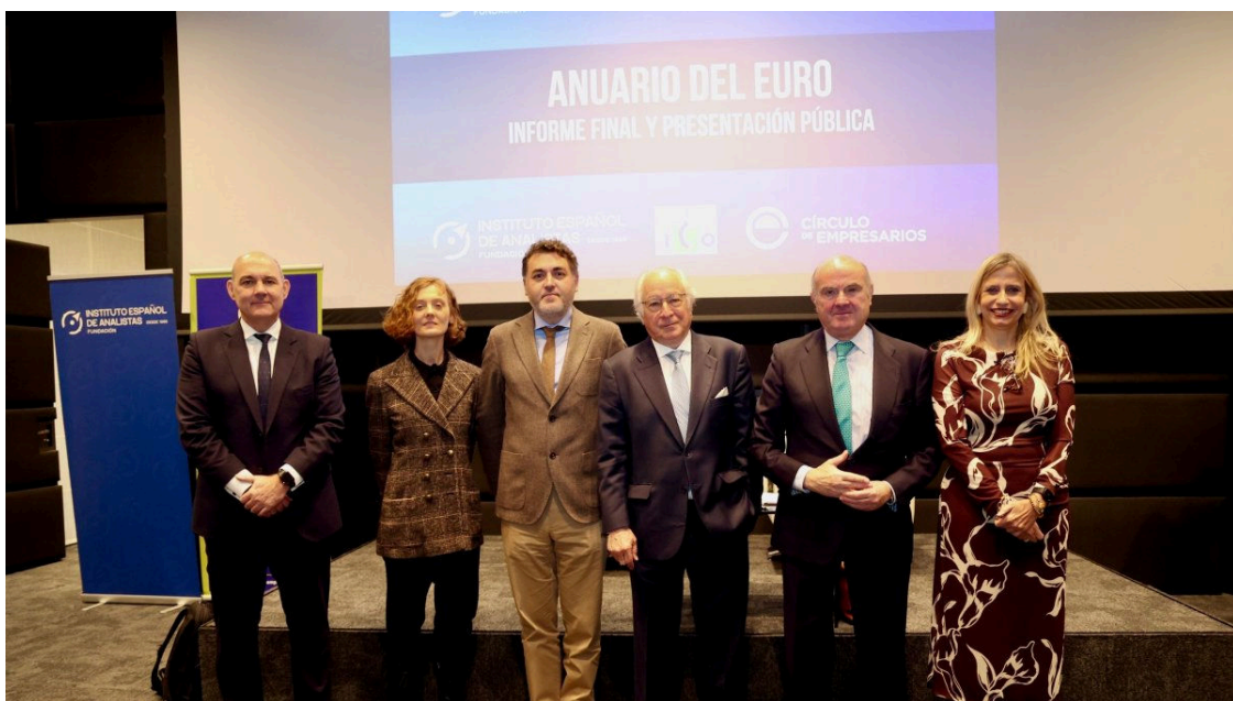
Los participantes en la jornada de presentación del anuario del Círculo de Empresarios.

Los expertos abogan por elevar la productividad, aplicar reglas fiscales creíbles y avanzar hacia una regulación financiera más competitiva.